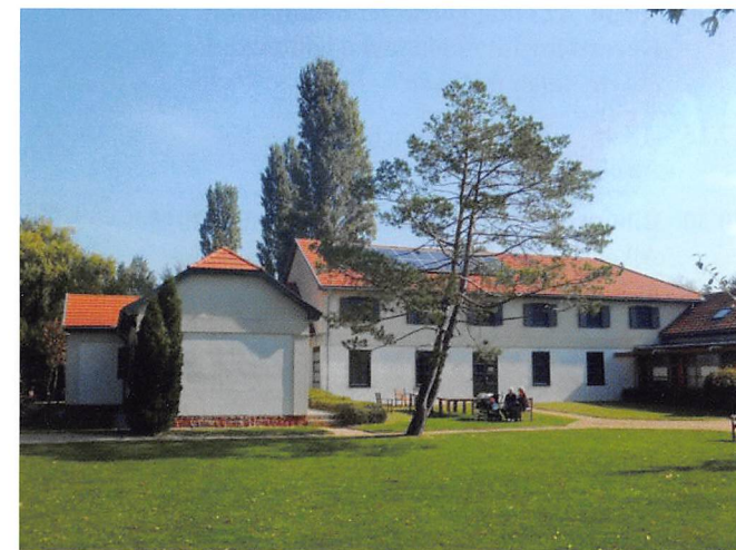
Evangelikus Konferencia és Missziói Központ

"Ahogy gondozza, úgy veszi hasznát" Ökológiai gondolkodás és társadalom