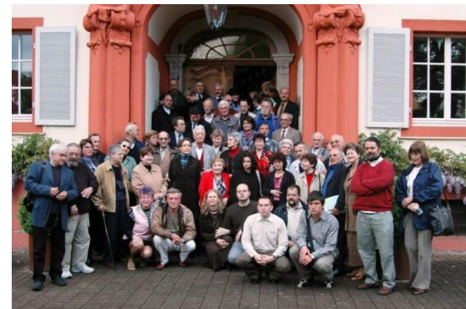
Az EPMSZ Akadémiai Napjain, 2005, Schloss Beuggen