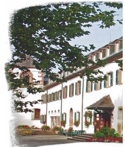
Château du Liebfrauenberg

Multilinguisme – enrichissement personnel