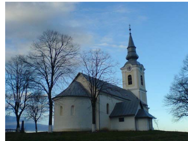
A siteri református templom • Biserica reformată Șișterea